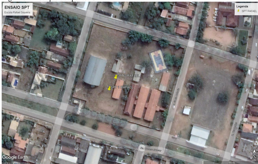
Figura 02 – locação dos pontos SPT